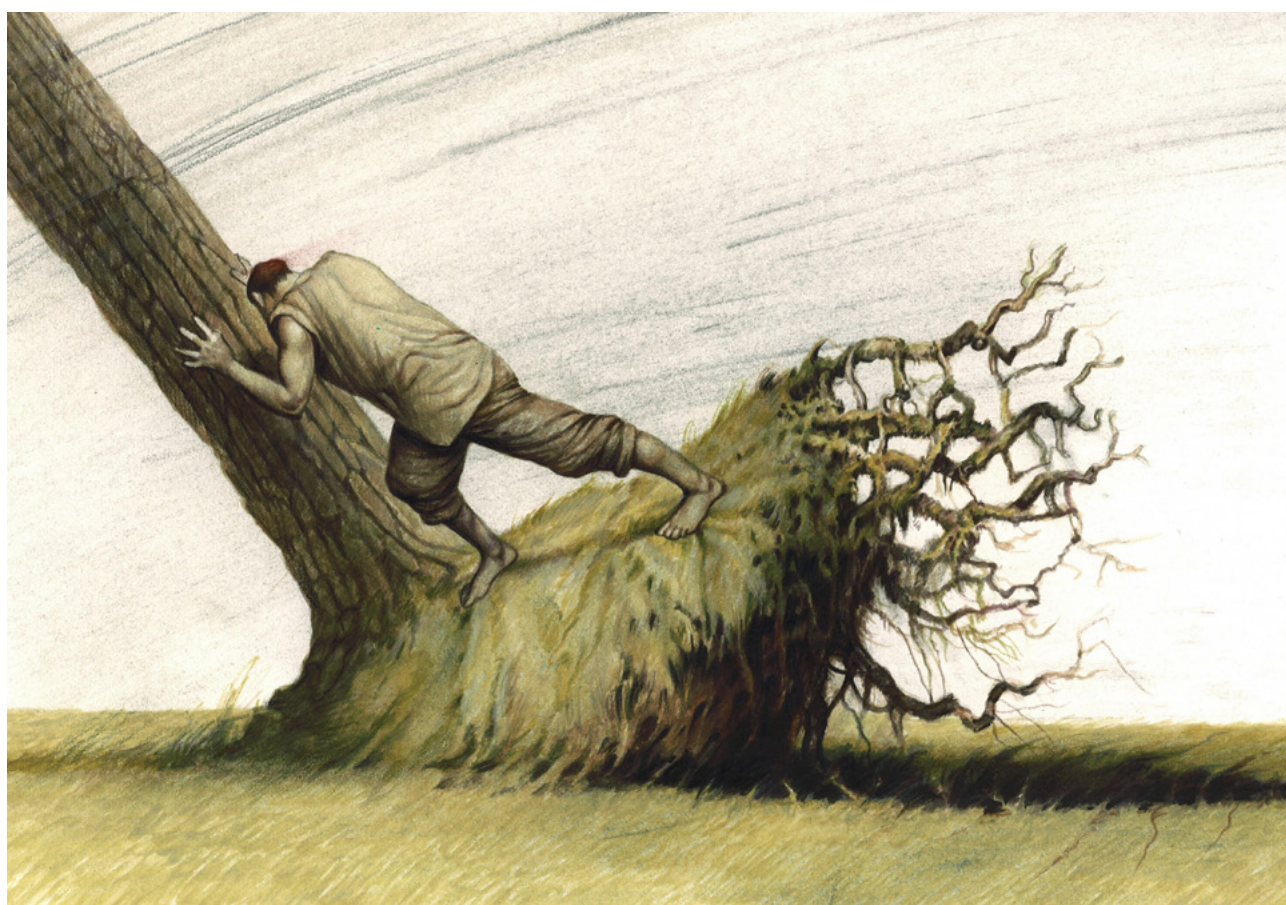
Agim Sulaj - Italia