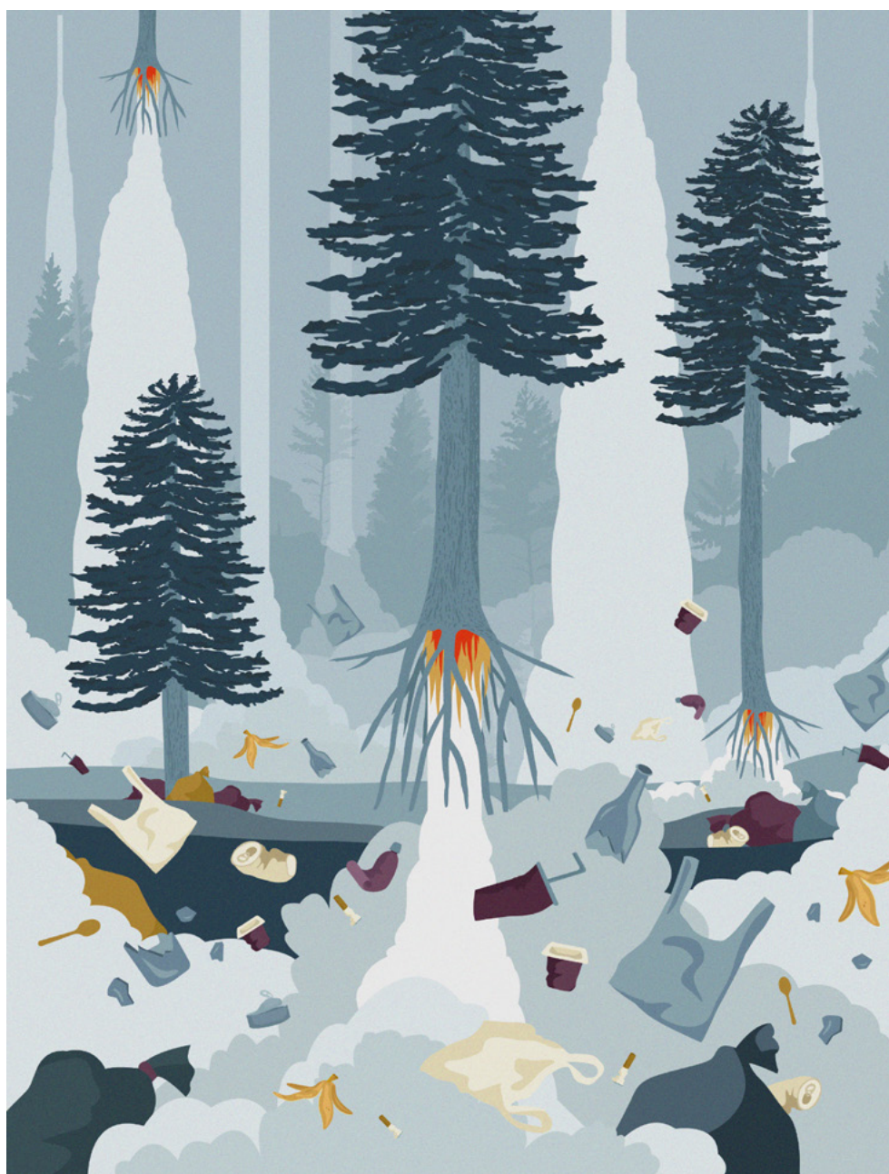
Anna Formilan - Italia