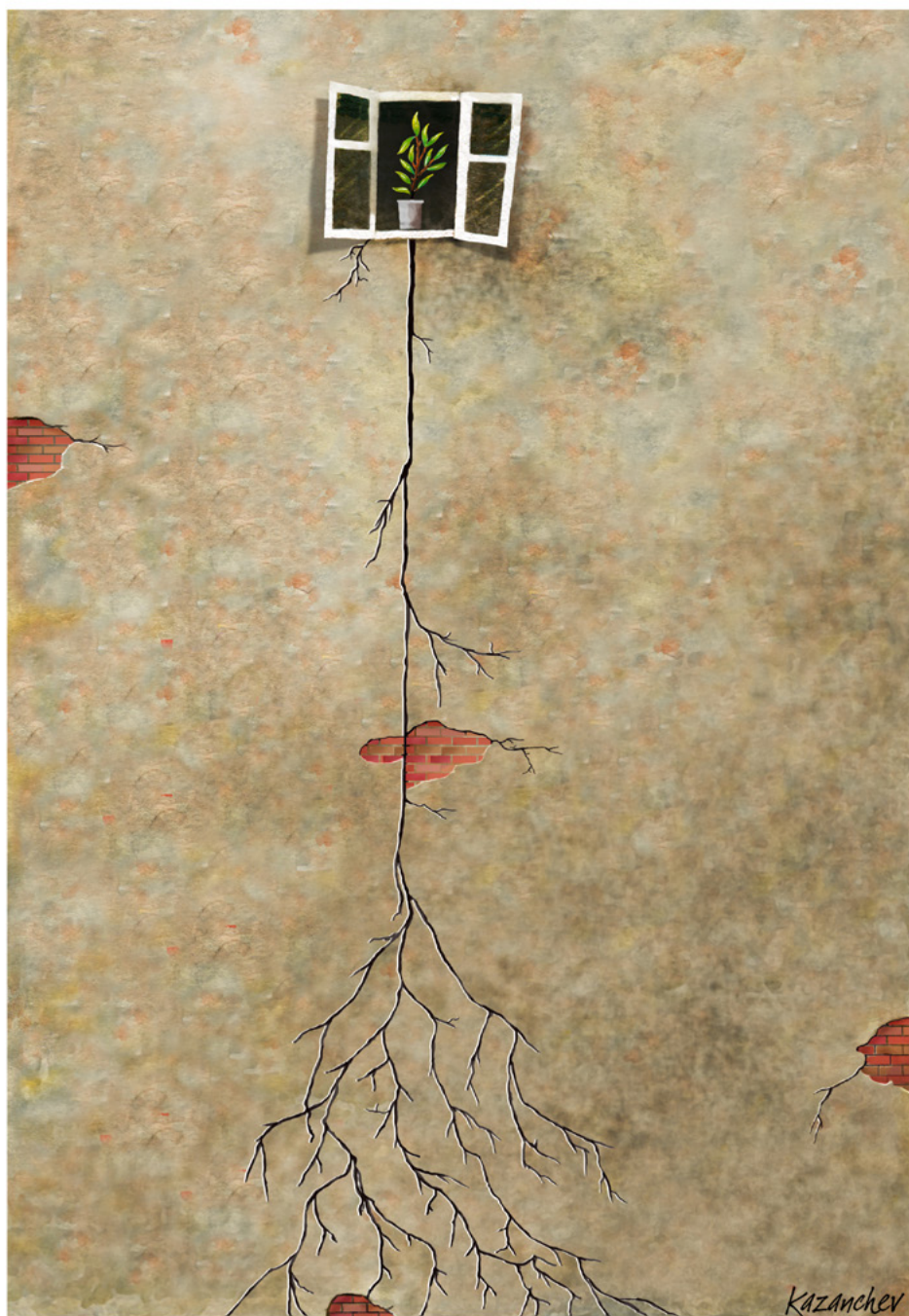
Konstantin Kazanchev - Ucraina