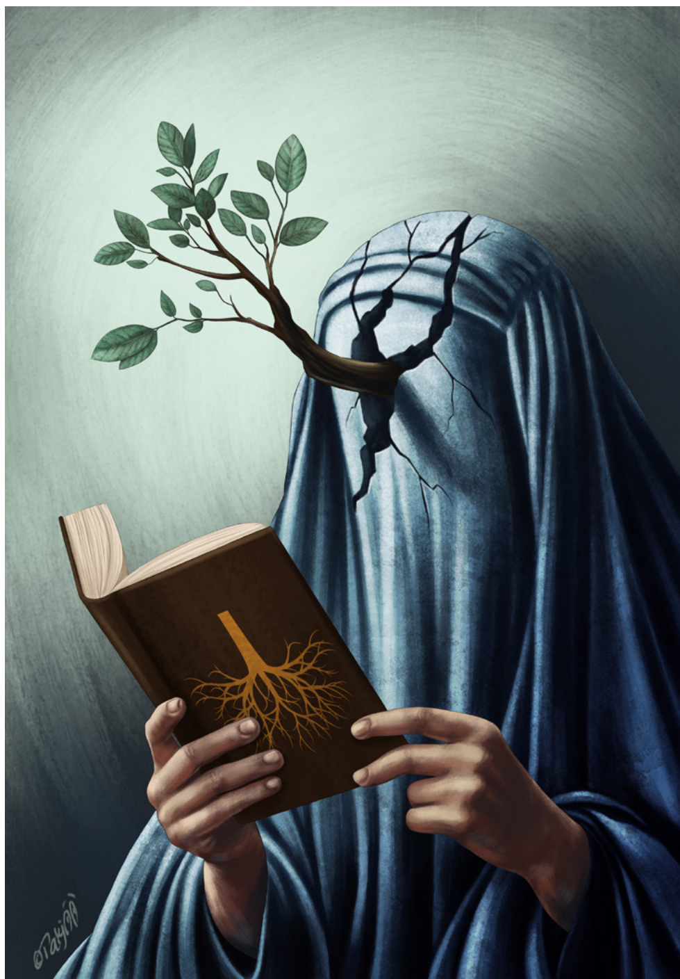
Javad Takjoo - Iran