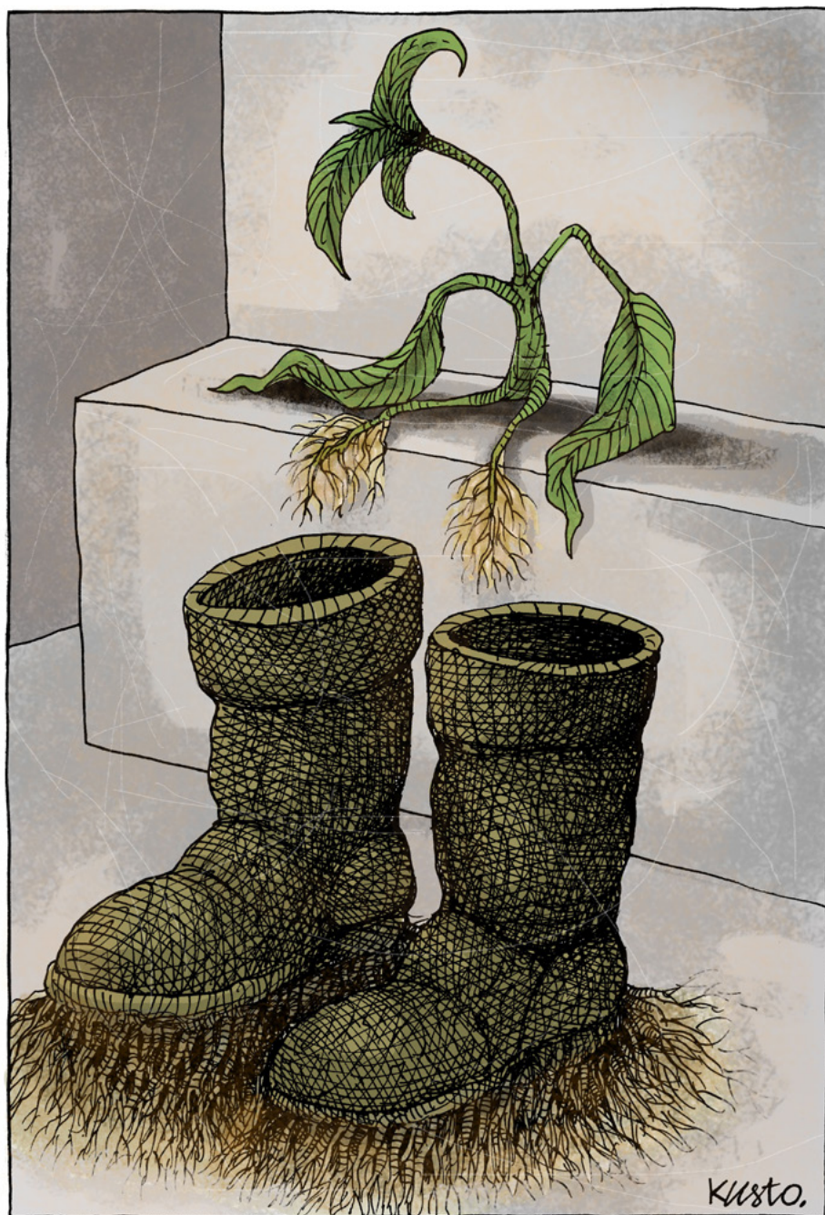
Oleksiy Kustovsky - Ucraina